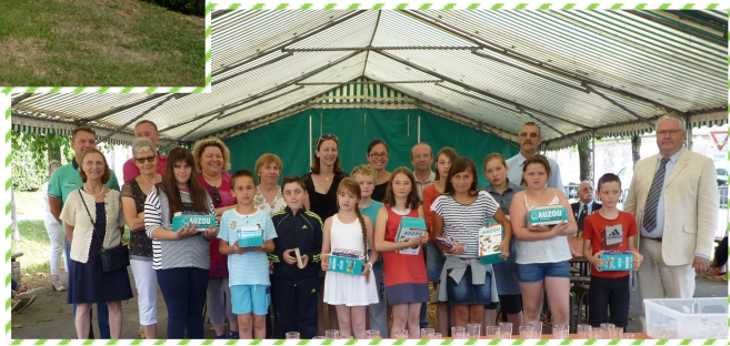
La remise des dictionnaires