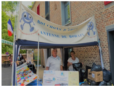
Les responsables départementaux de l'antenne de Bohain venus présenter l'association lors de la fête du moulin.